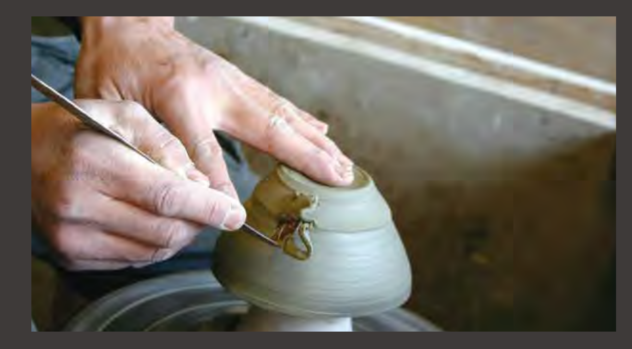
URBAN RESEARCH DOORS 陶芸作家・石松信彦さんのろくろ体験