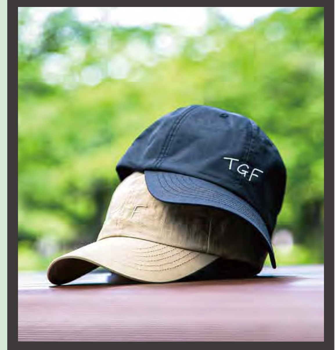
TGF ワンポイント刺繍6PCAP