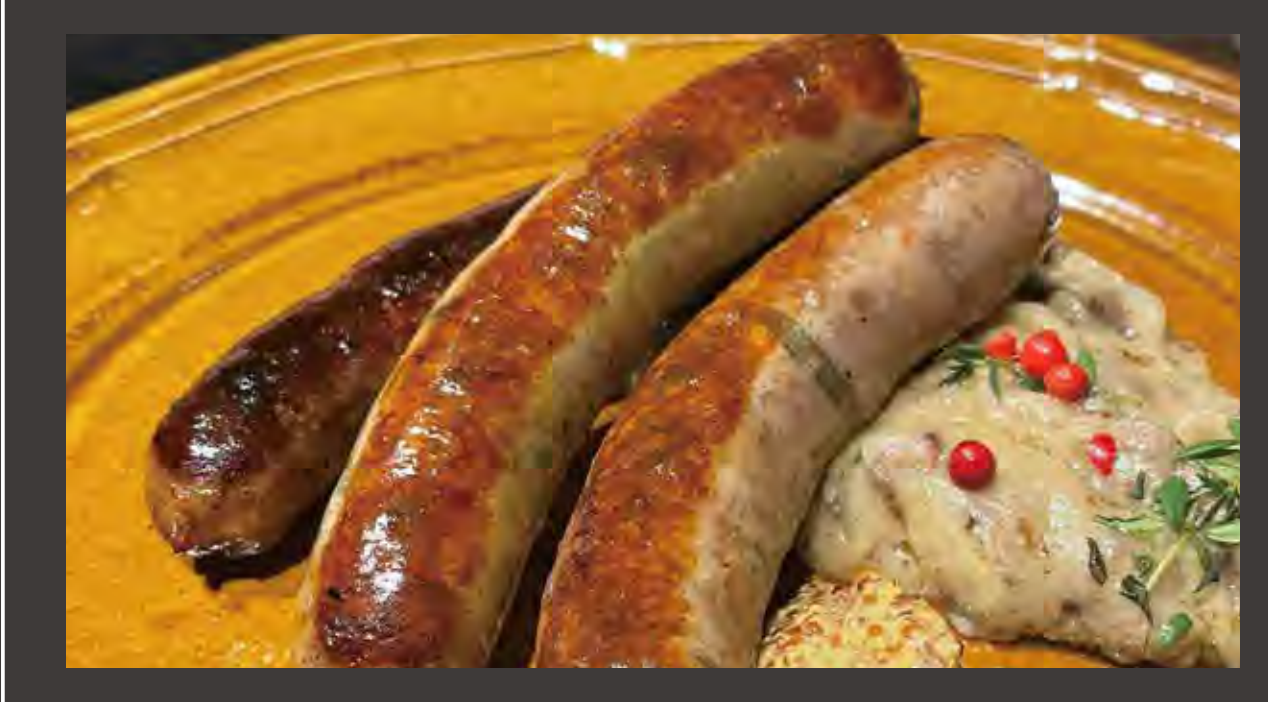
kurkku alternative with Antler Craft ジビエ鹿ビストロ