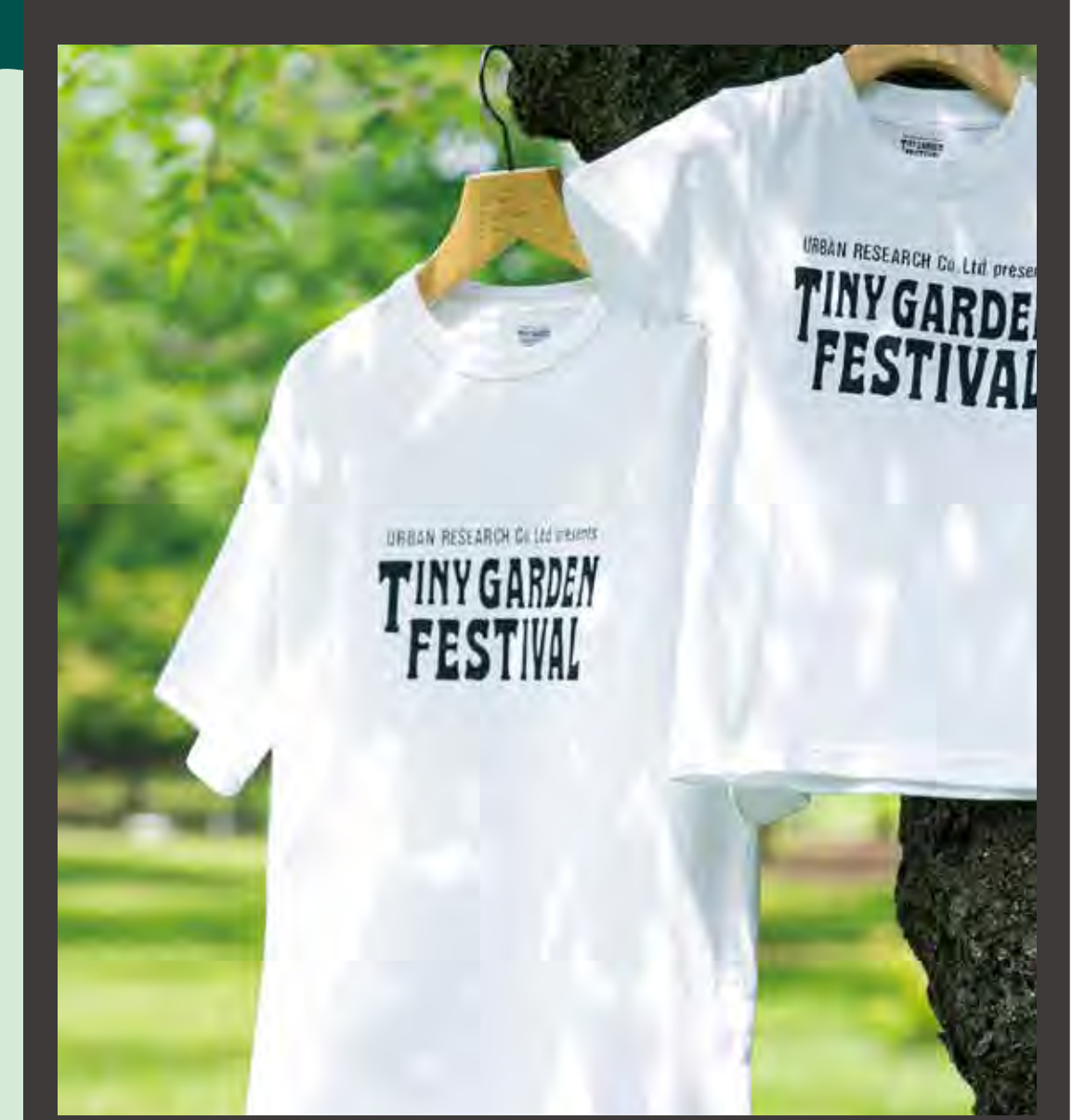
TGF オフィシャルロゴプリントTシャツ