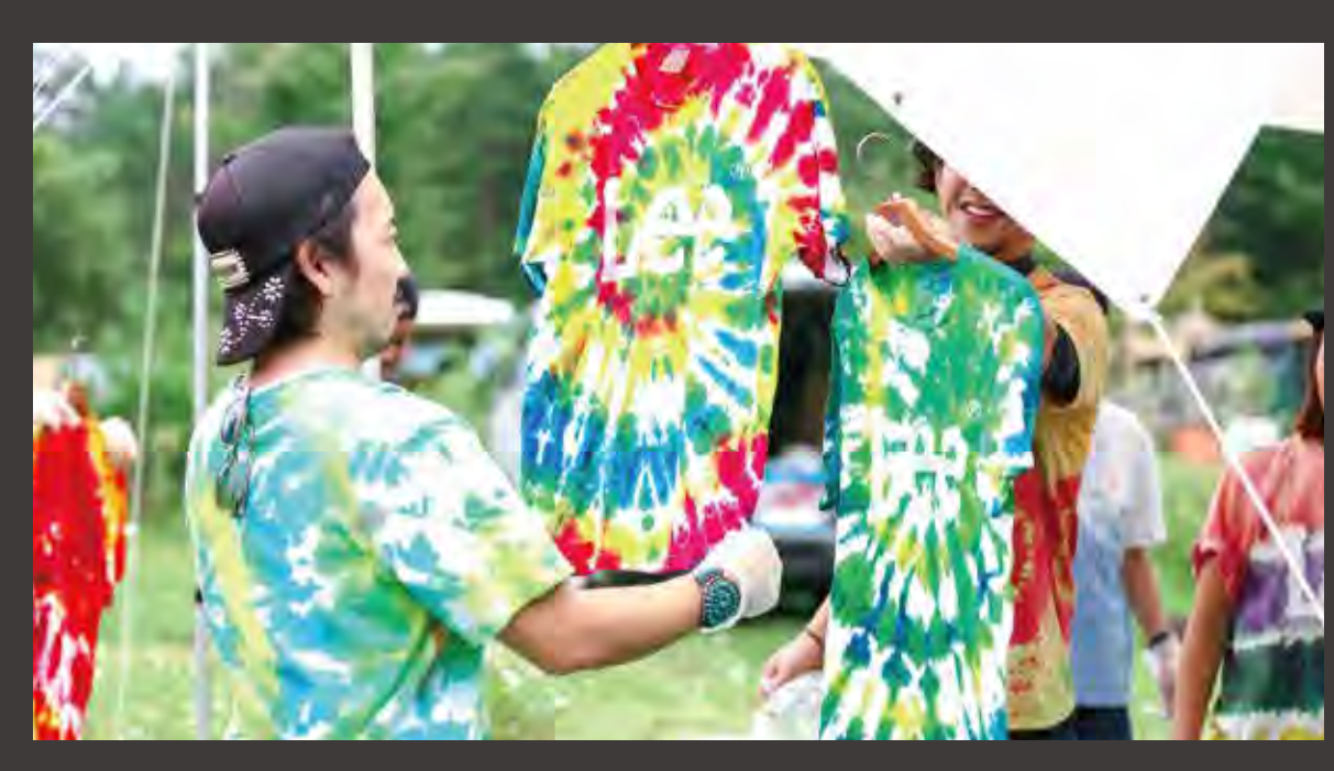
Lee タイダイ染め体験