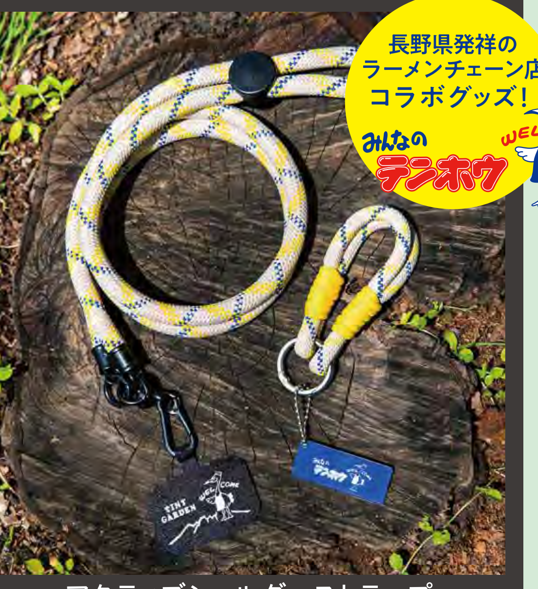
アクティブショルダーストラップ マルチユーススキーホルダー