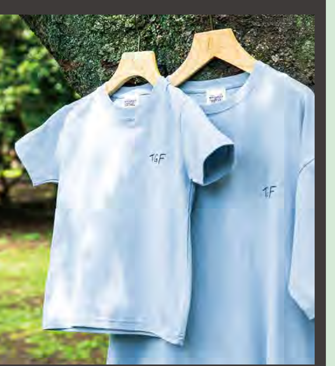
TGF ワンポイント刺繍Tシャツ