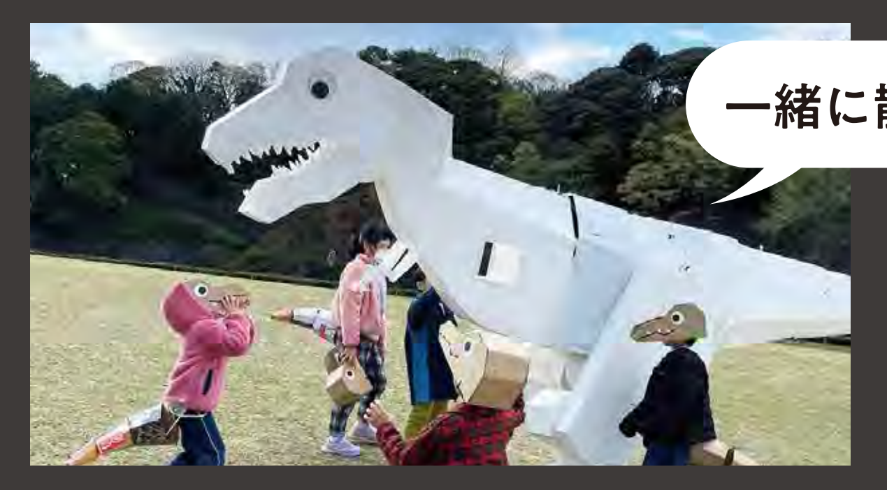
JAPAN MADE PROJECT 段ボールなりきりティラノ作り